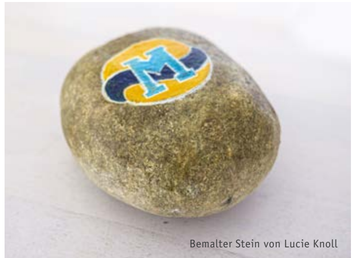
Bemalter Stein von Lucie Knoll