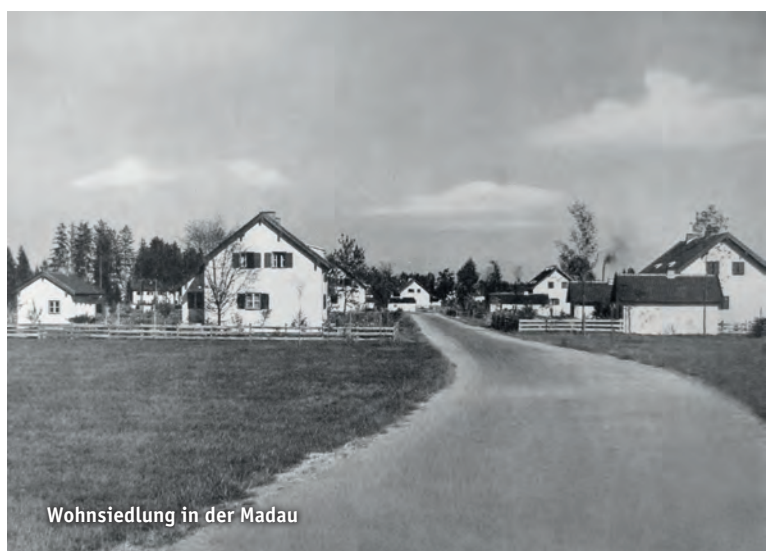
Wohnsiedlung in der Madau