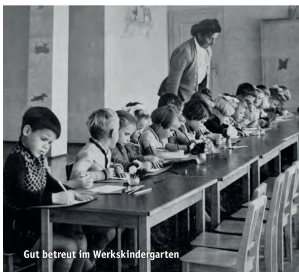
Gut betreut im Werkskindergarten

1983 ging mit der Schließung des Werkes nicht nur der traurige Verlust von vielen Arbeitsplätzen einher, sondern auch das Ende der Ära der Wolldeckenfabrik in Bruckmühl. Selbst eingeschaltete Landtagsabgeordnete konnten die Schließung nicht verhindern. Einem Teil der Belegschaft bot man Arbeitsplätze im zweiten, noch gewinnbringenden Werk in Regensburg an. Doch für viele langjährige Mitarbeiter war dies keine Option; man hatte ja schließlich mit Familie und Eigentum in Bruckmühl sein Zuhause gefunden.